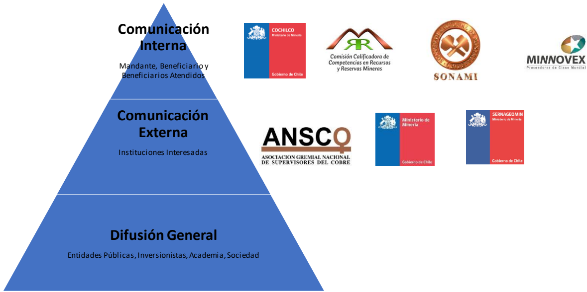
Figura 7-1: Estrategia de Comunicación

Con el fin de responder de manera específica a los diversos grupos destinatarios, la ¡Error! No se encuentra el origen de la referencia. muestra un esquema con las diversas acciones para la difusión de resultados, que se agruparán en tres ejes de acción: