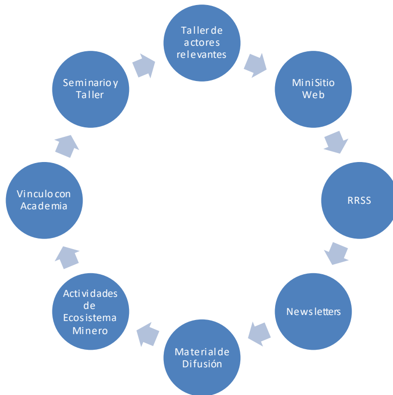
Figura 8-1: Herramientas

Las herramientas y elementos clave de difusión y comunicación son los siguientes: