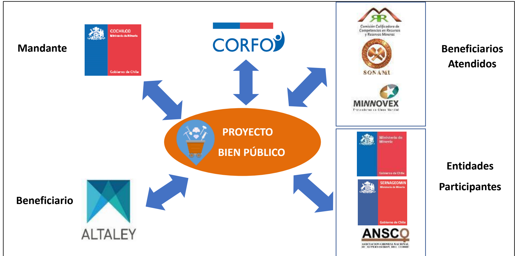
Figura 3.1: Modelo de Gobernanza